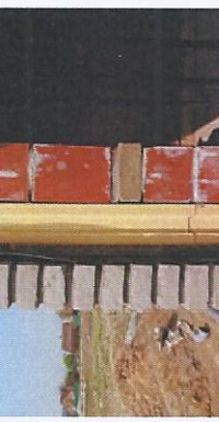
Beton & staal

Alle dorpels zijn in arduin met vlak gezoet uitzicht. Aan de dorpels van de deuren is er bovendien een opstand van 1 cm.